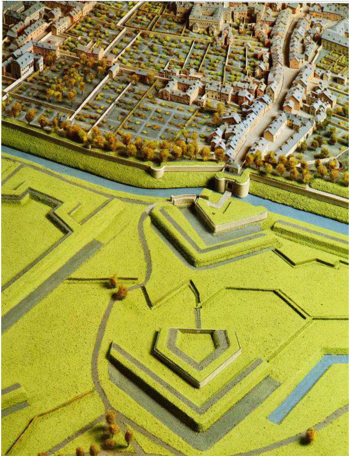
Afbeelding van de maquette Vestingstad Maastricht, die tijdens de Groenconferentie in het Centre Céramique zal worden tentoongesteld. Hier de situatie nabij de Tongerse Poort met diverse boomgaarden, nuts- en moestuinen binnen de muren.